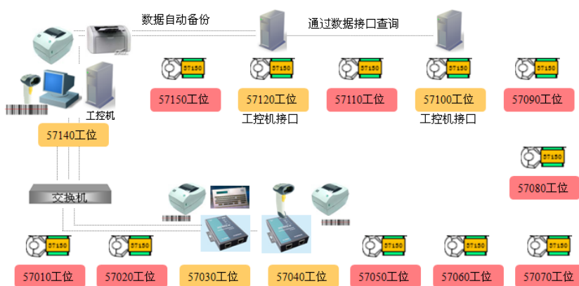
施耐德电气SBMV工位及硬件设备部署图

精诚 EAS-MES 生产制造执行系统基于大量的网络硬件设备和条码扫描设备, 这些设备的正常运行保证了系统的稳定, 是生产车间管理系统安全、高效、稳定运行的前提, 包括: